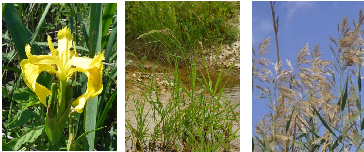
Figura 3 – Specie IBMR presenti nel Collettore Alfieri (CA). A sinistra Iris pseudacorus , al centro Typhoides arundinacea e a destra Phragmites australis .

Di seguito si riportano alcune immagini relative alle specie vegetali acquatiche che hanno concorso al calcolo dell'indice trofico.