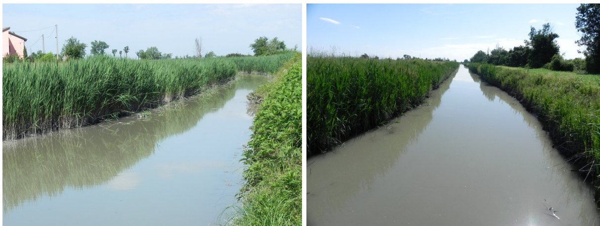
Figura 2 – Sezione di monte (a sinistra) e sezione di valle (a destra) oggetto di campionamento del primo tratto del Collettore Alfieri (CA).

Al momento del campionamento il canale presentava un battente d'acqua significativo, che non ha consentito l'ingresso in acqua, così come previsto dalla metodologia di campionamento. Inoltre, il fondale particolarmente melmoso non ha consentito l'accesso all'interno dell'alveo bagnato. Si è proceduto campionando sulle rive, i taxa che presentavano almeno l'apparato radicale immerso.