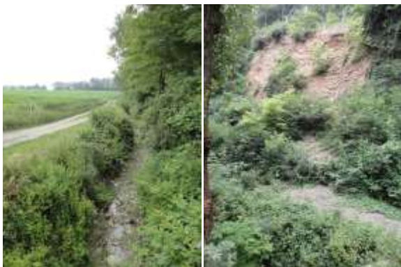
A sinistra: la viabilità locale interessa direttamente l'alveo del rio Lavezza; a destra: tratto in erosione del rio Enzola

La definizione del Programma degli interventi materiali ed immateriali sarà sviluppata seguendo un Processo partecipato a supporto del progetto di coinvolgimento dei portatori di interesse locali, nazionali ed internazionali, pubblici o privati. Il processo di partecipazione adotterà metodi formalizzati di coinvolgimento, ispirandosi alla metodologia sperimentata in Italia per i contratti di fiume. Il programma non trascurerà di fornire inoltre indicazioni per la valorizzazione degli elementi storico-culturali, paesaggistici e fruitivi.