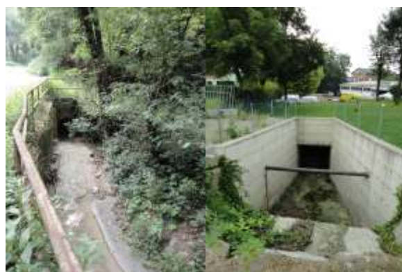
Esempi di tratti intubati nell'area di intervento

Con il progetto RII si vuole infine mostrare come le strategie di riqualificazione idraulico-ambientale dei rii possiedano potenzialità in termini di miglioramento della qualità delle acque superficiali e sotterranee, grazie all'aumento della capacità autodepurativa dei corsi d'acqua che queste azioni permettono di ottenere. Una tale strategia consentirà quindi di contribuire, anche parzialmente, al raggiungimento degli obiettivi della Direttiva Nitrati 91/676/CEE (l'area di studio ricade infatti interamente in "zona sensibile da nitrati di origine agricola").