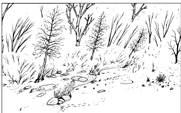
Vista concettuale di riqualificazione, da Progetto

La strategia di restituzione di spazio al reticolo minuto può invece essere applicata nei tratti pianeggianti a monte e a cavallo della fascia urbanizzata, nei casi in cui vi siano aree ancora disponibili, ma soprattutto nella pianura a valle dei centri abitati, ove i corsi d'acqua scorrono arginati e spesso pensili. In questi ambiti, oltre a dimostrare l'utilità di interventi fisici di allargamento di sezione mediante arretramento degli argini e sbancamento delle sponde, strategia già in uso da anni a livello europeo, il progetto si pone l'obiettivo di individuare e mettere a punto strumenti innovativi economico-giuridico-amministrativi utili a permettere l'utilizzo delle aree agricole per l'esondazione delle piene, a salvaguardia dei centri abitati. Secondo la strategia individuata dal progetto, tali strumenti devono permettere di conciliare le finalità idrauliche delle aree con una parziale riqualificazione ecologica.