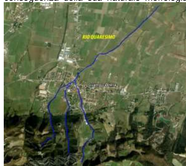
Il rio Quaresimo: i tre rami sottopassano intubati l’abitato di Quattro Castella

Il reticolo minuto che raccoglie le acque in ambito montano, spesso costituito da piccoli rii di 1-2 m di larghezza dal carattere torrentizio, è infatti caratterizzato da forti pendenze e dalla quasi totale assenza di aree per l'espansione delle piene, come conseguenza della sua naturale morfologia.