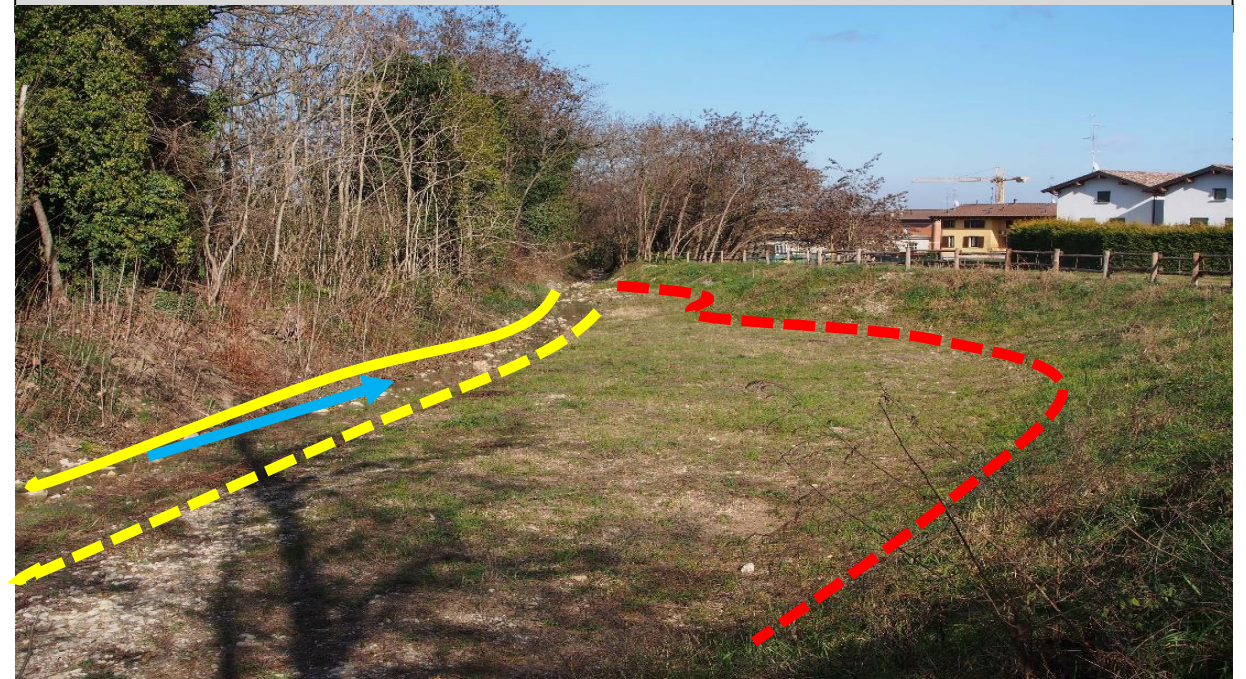
Sito di intervento durante il rilievo del 19/02/2016. In giallo continuo la sponda sinistra, in giallo tratteggiato la sponda destra pre intervento, in rosso la sponda destra arretrata.