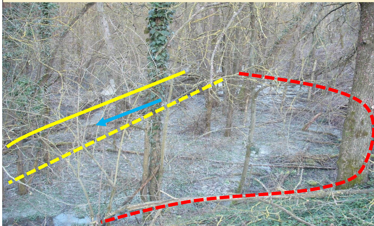
Sito di intervento Ante Operam (20/03/2013). In giallo continuo la sponda destra, in giallo tratteggiato la sponda sinistra pre intervento, in rosso la sponda sinistra arretrata