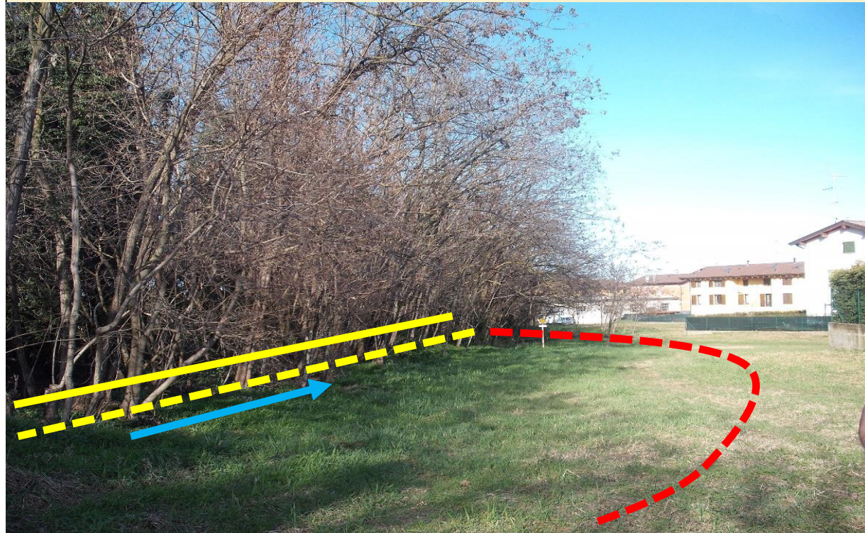
Sito di intervento Ante Operam (23/04/2013). In giallo continuo la sponda sinistra, in giallo tratteggiato la sponda destra pre intervento, in rosso la sponda destra arretrata.