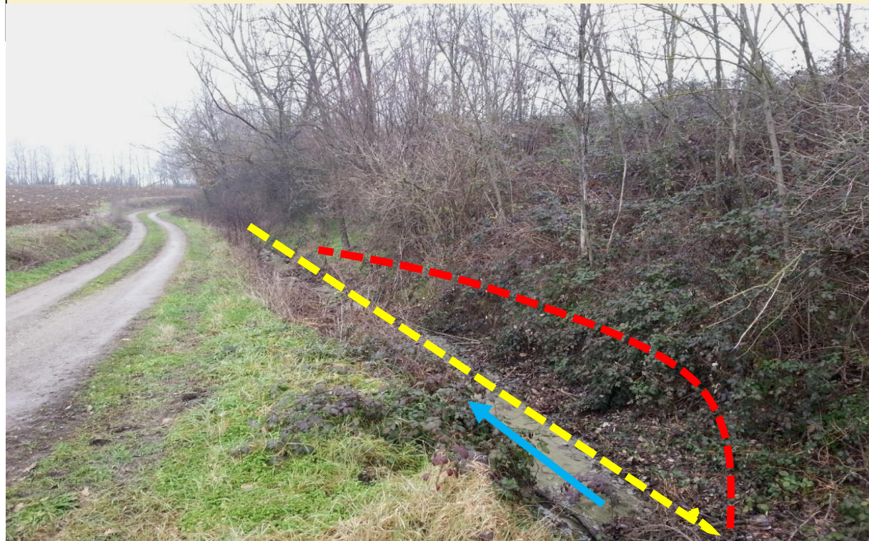
Sito di intervento Ante Operam (23/04/2013). In giallo la sponda destra pre intervento, in rosso la sponda arretrata