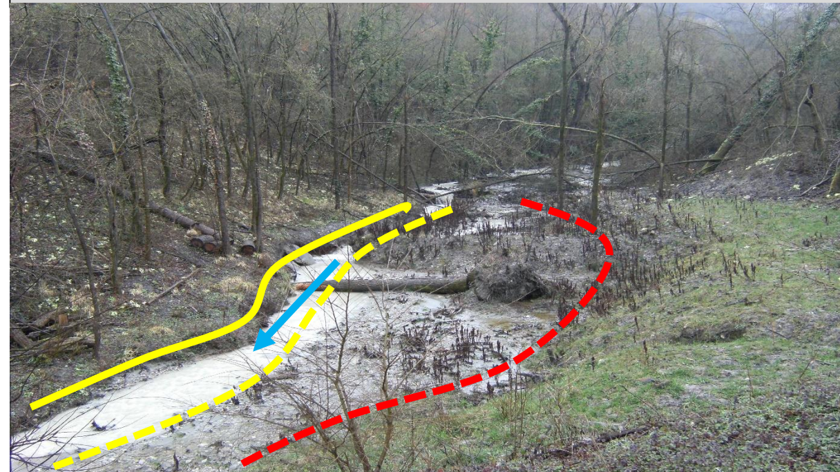
Sito di intervento durante l'evento piovoso del 09/03/2016. In giallo continuo la sponda destra, in giallo tratteggiato la sponda sinistra pre intervento, in rosso la sponda sinistra arretrata