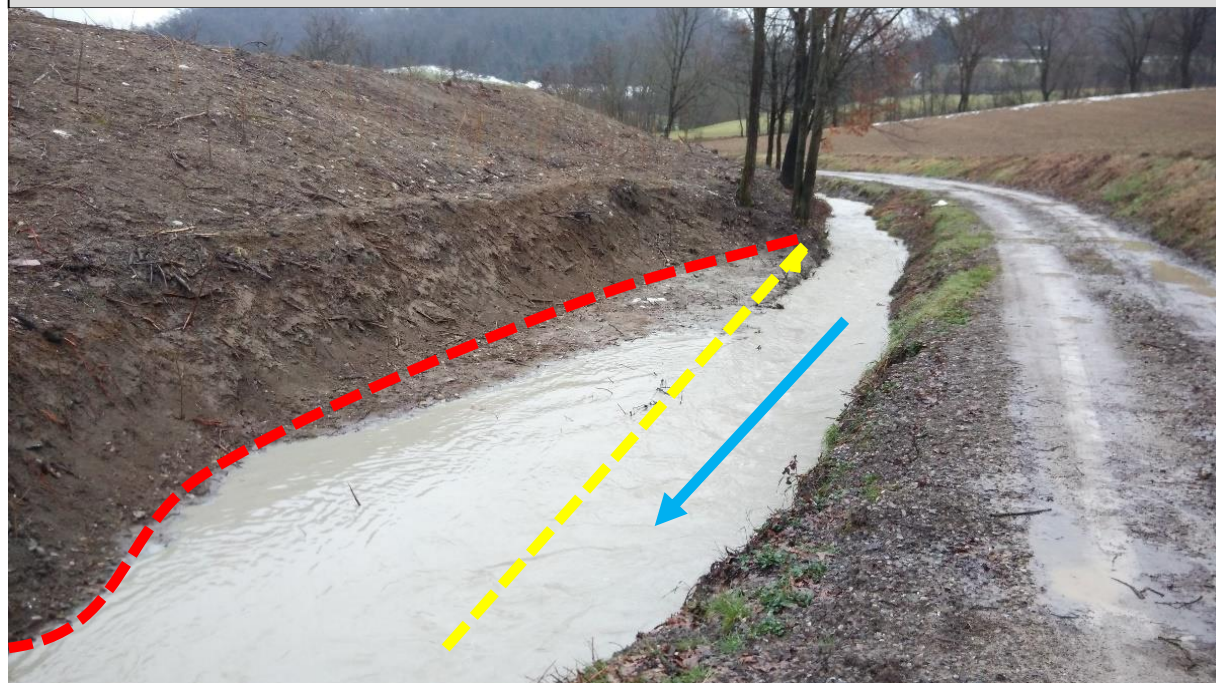
Sito di intervento durante l'evento piovoso del 22/02/2015. In giallo la sponda destra pre intervento, in rosso la sponda arretrata