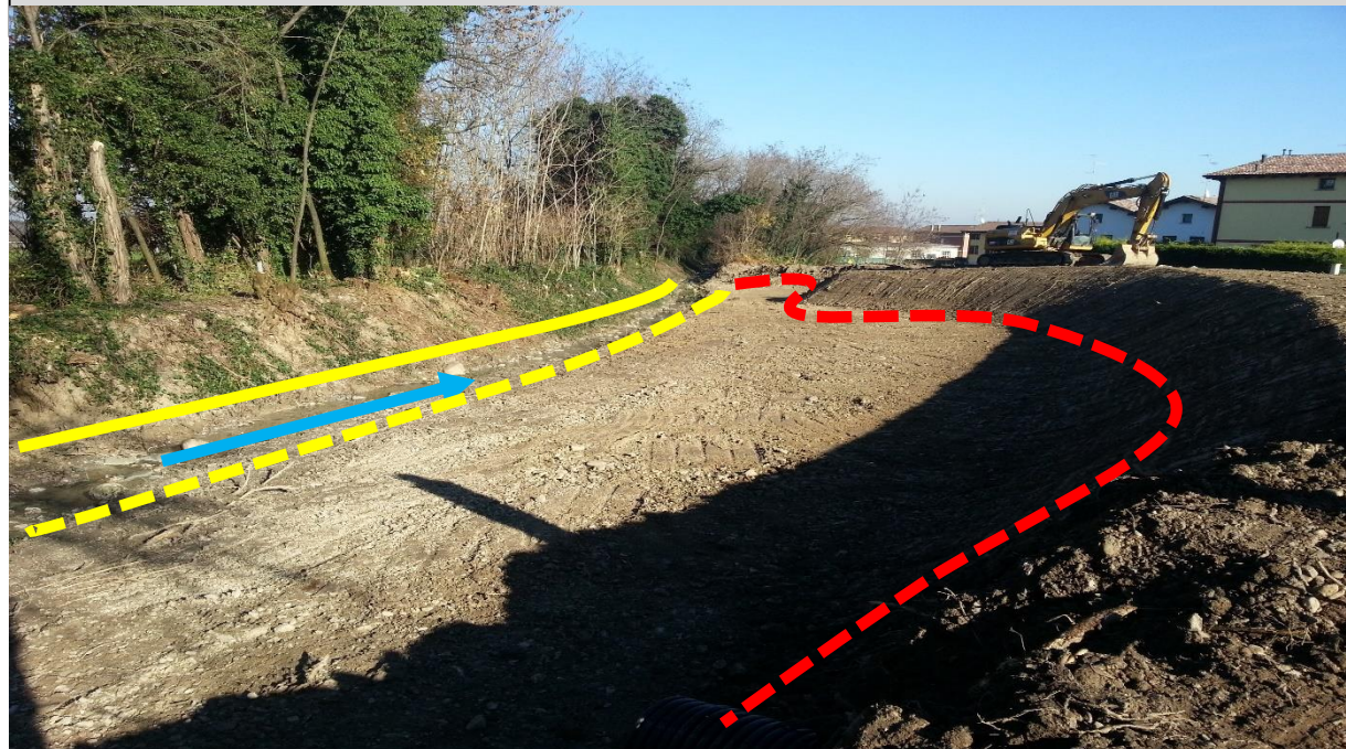
Sito di intervento durante il rilievo del 11/12/2014. In giallo continuo la sponda sinistra, in giallo tratteggiato la sponda destra pre intervento, in rosso la sponda destra arretrata.