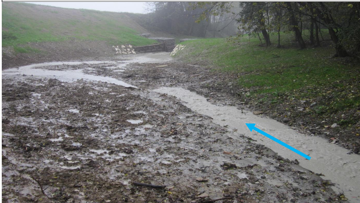
Sito di intervento durante il rilievo del 10/11/2014