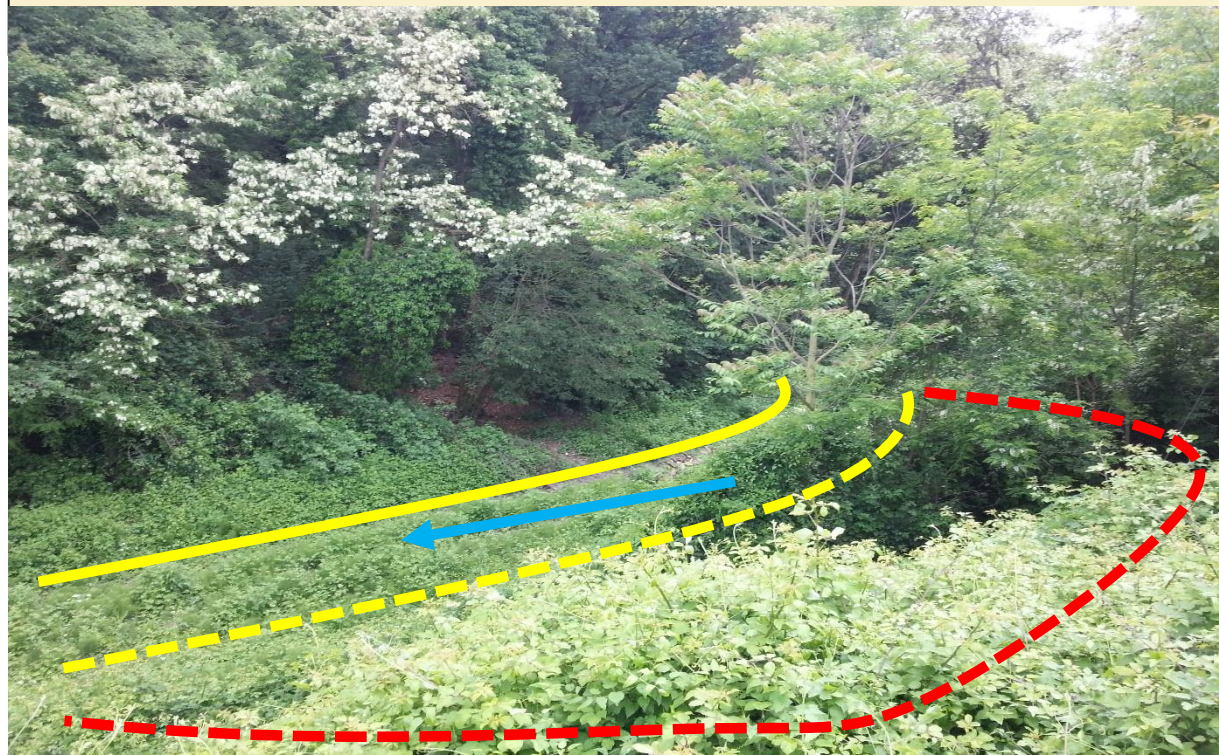
Sito di intervento Ante Operam (20/05/2013). In giallo continuo la sponda destra, in giallo tratteggiato la sponda sinistra pre intervento, in rosso la sponda sinistra arretrata.