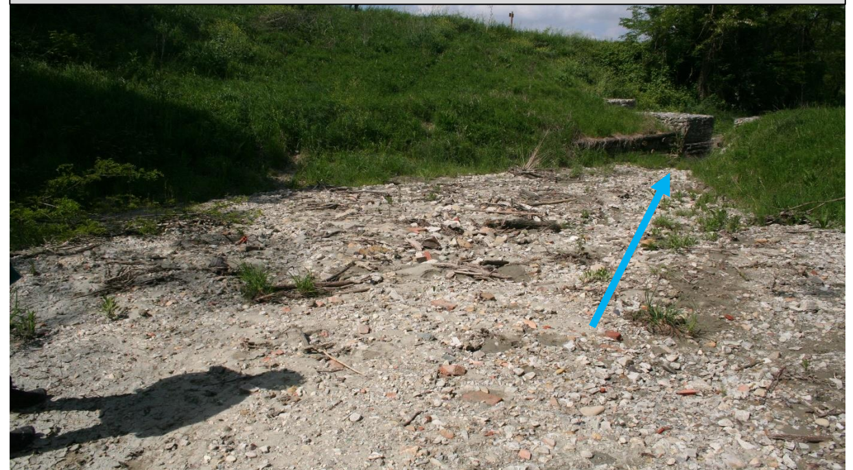
Sito di intervento durante il rilievo del 29/04/2016