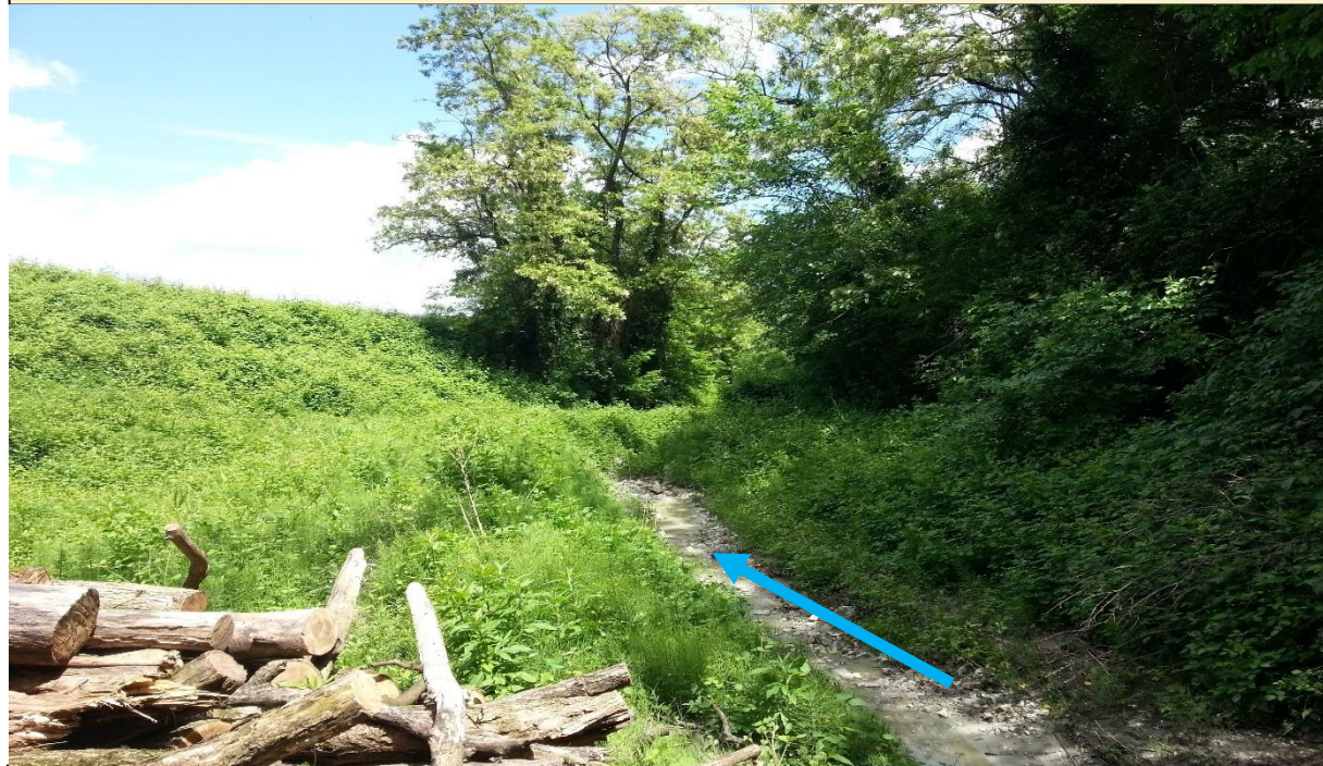
Unità morfologiche rilevate il 19/03/2013