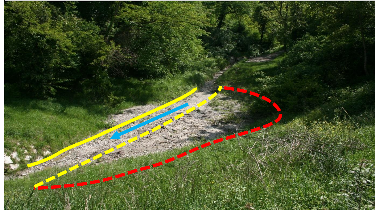
Sito di intervento durante il rilievo del 29/04/2016. In giallo continuo la sponda destra, in giallo tratteggiato la sponda sinistra pre intervento, in rosso la sponda sinistra arretrata.