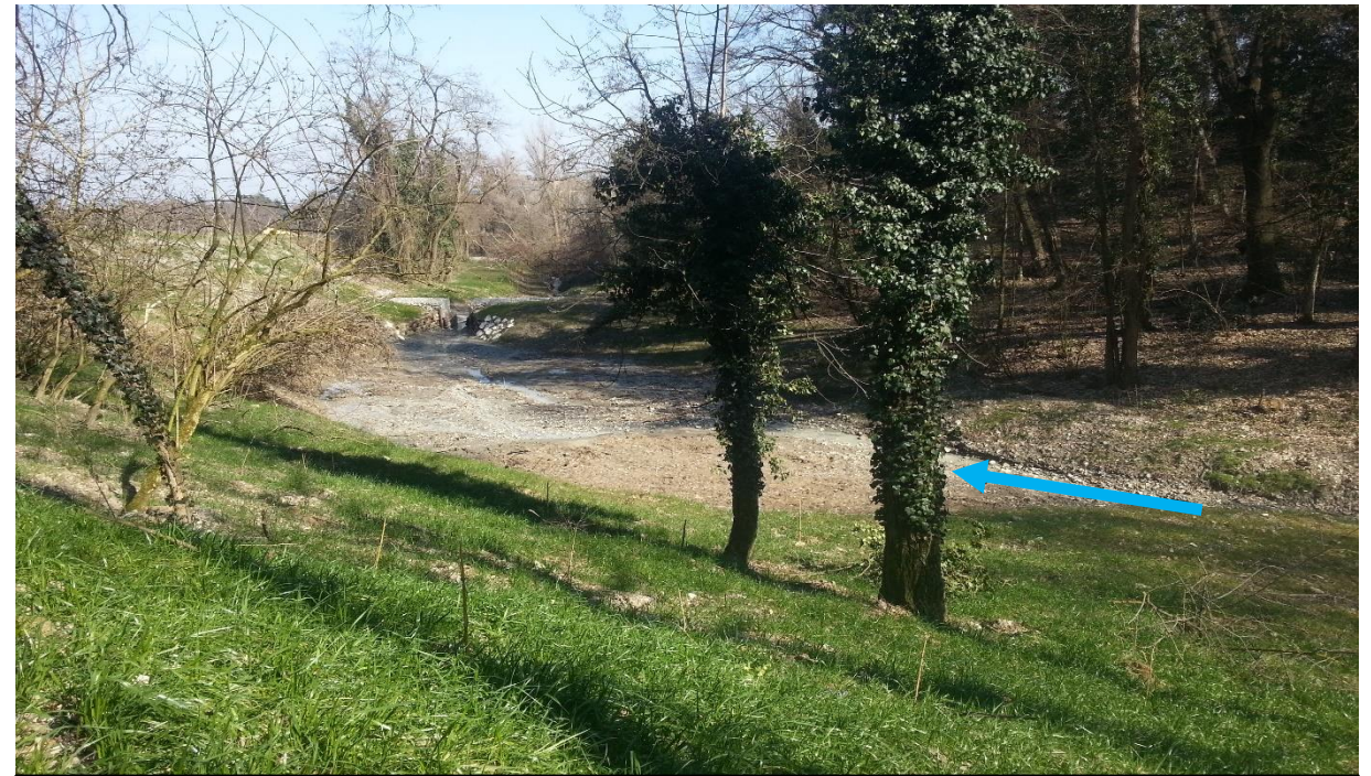
Unità morfologiche rilevate il 10/03/2015