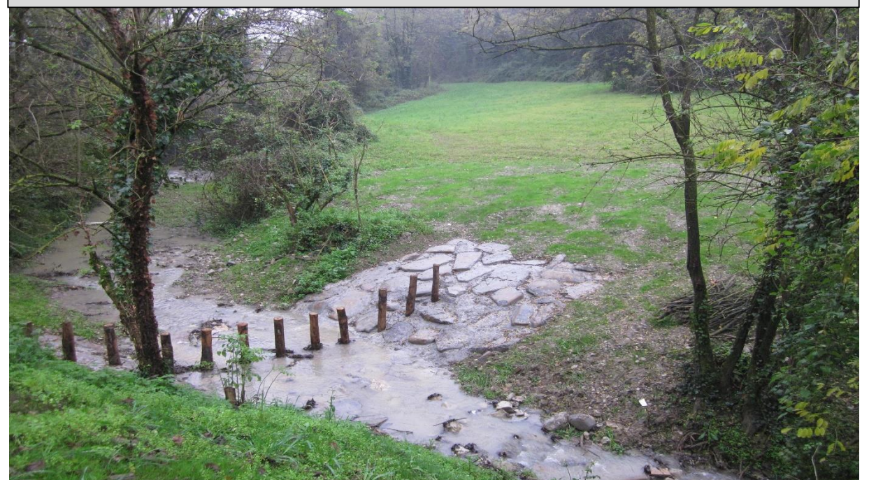
7 - Briglia selettiva