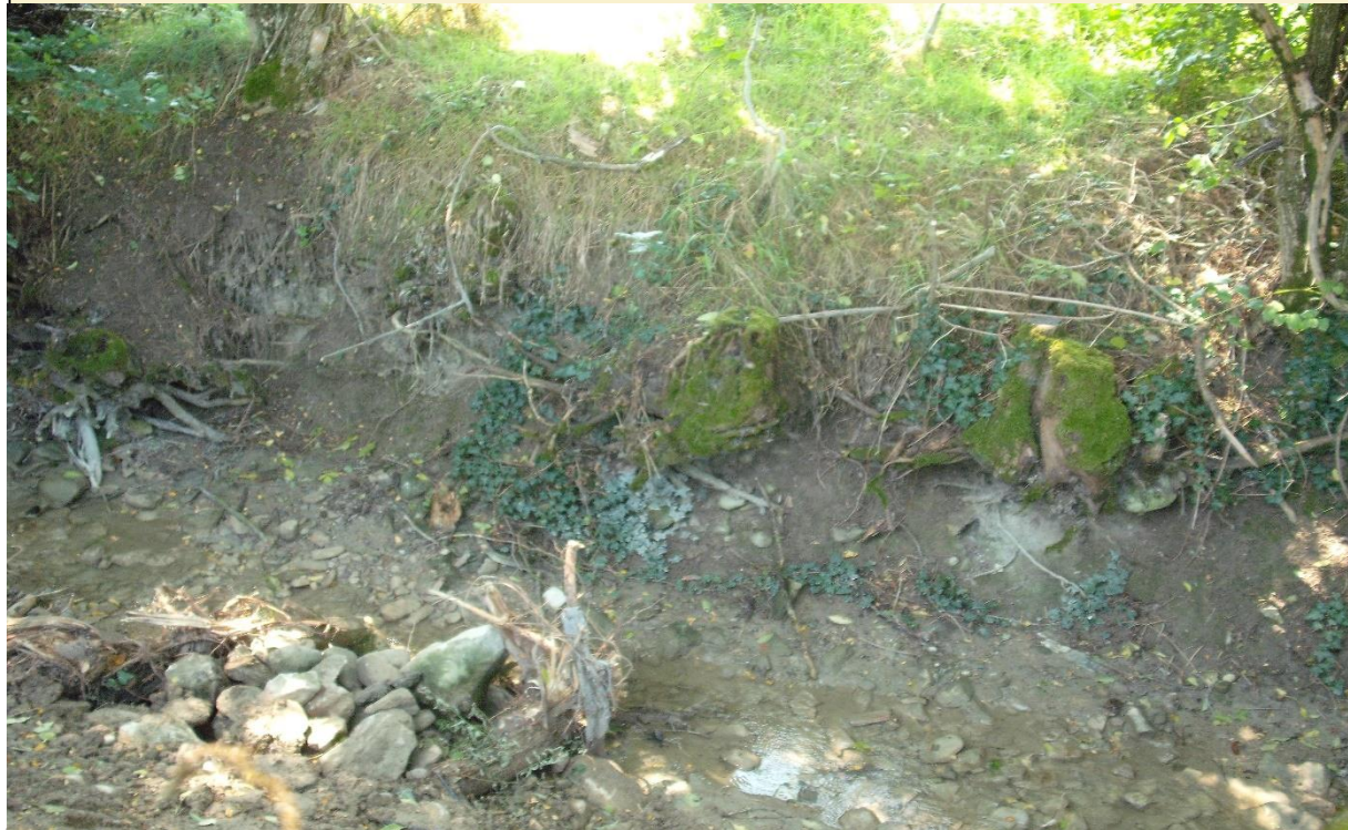
8 – Deflettore di corrente (05/08/2014)