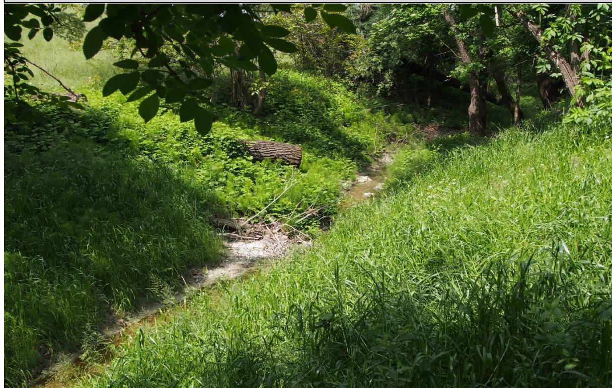
1 – Salto di fondo (tronchi incrociati) (05/05/2015)