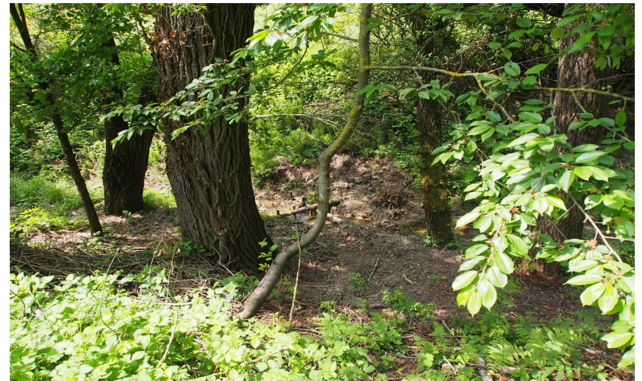
2 – Salto di fondo (tronchi incrociati) (05/05/2015)