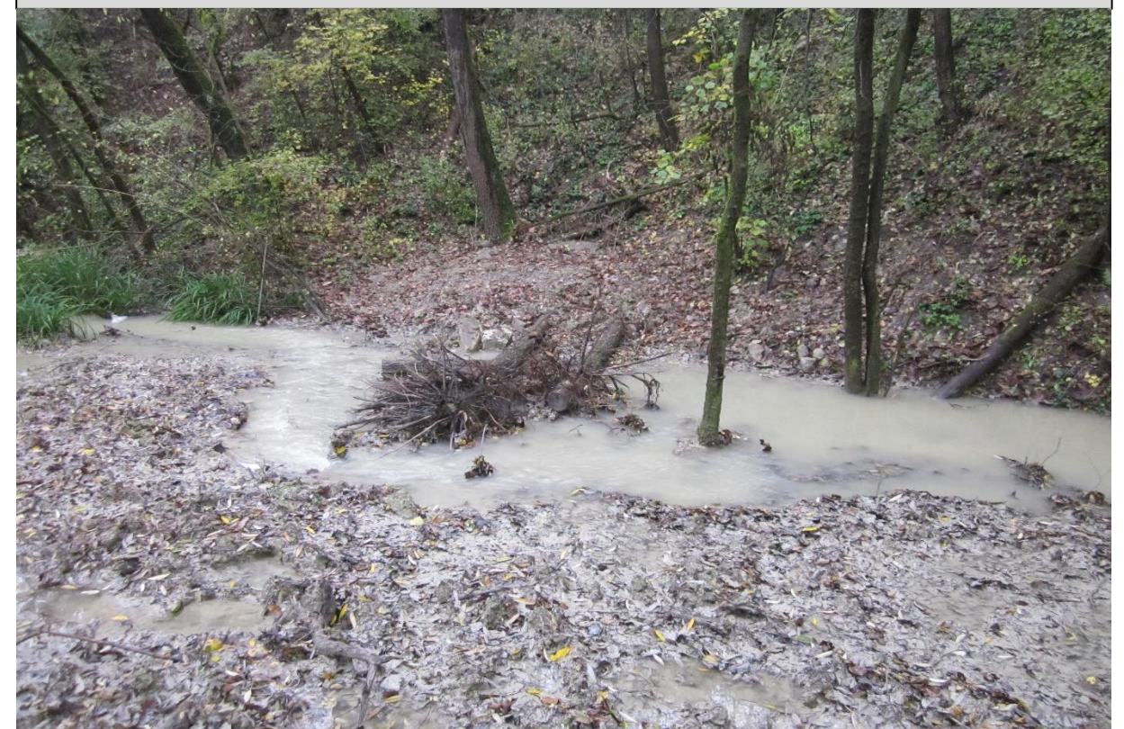
3 - Deflettori di corrente, già analizzato con apposita scheda