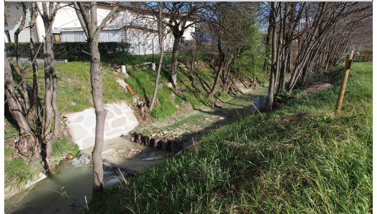
11 – Briglia selettiva (19/02/2016)