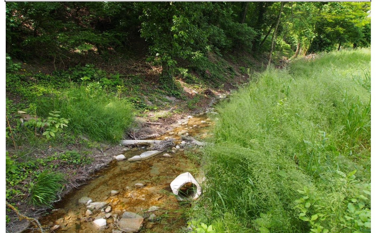
3 - Tronchi a radici esposte (05/05/2015)