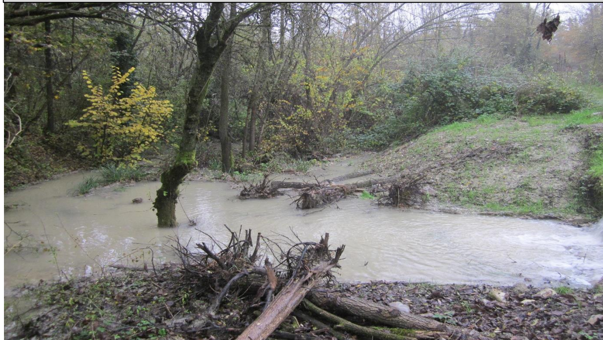
5 - Deflettori di corrente