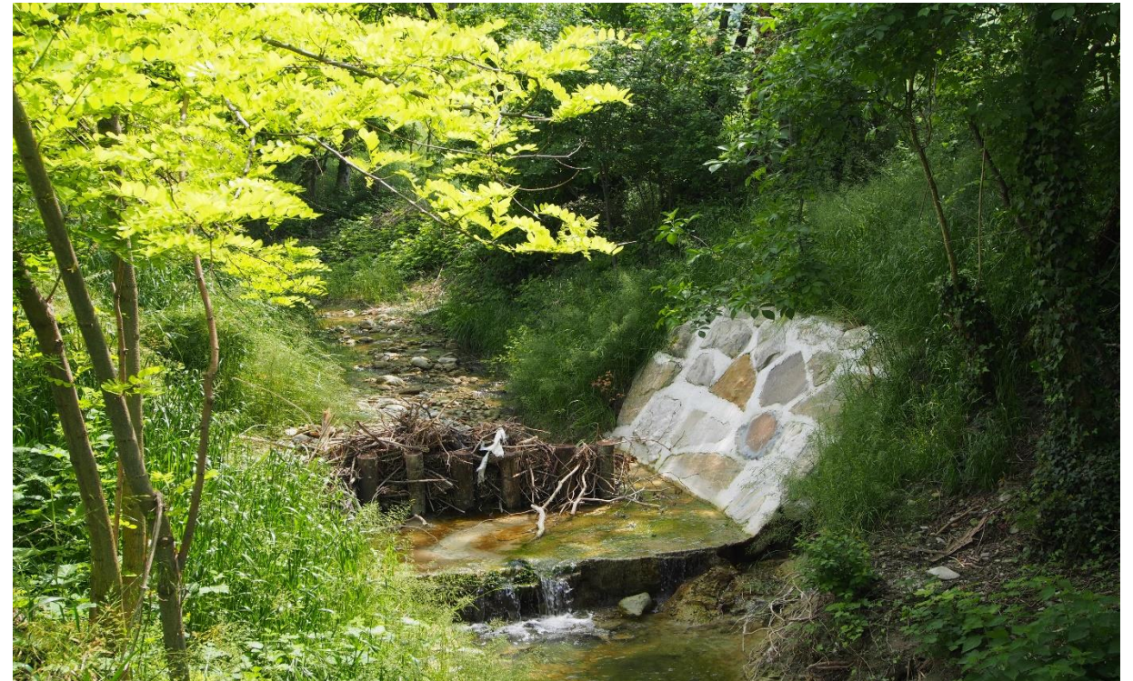
10 – Briglia selettiva (05/05/2015)