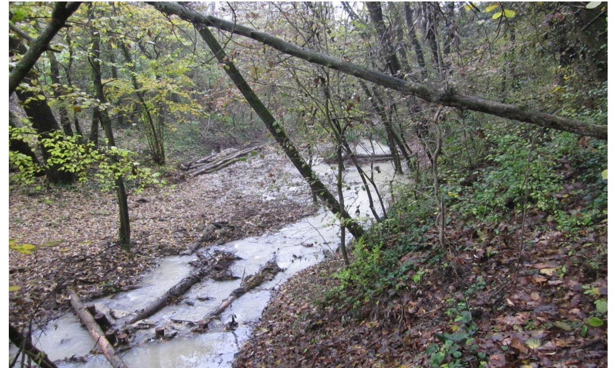
2 - Salto di fondo con radici esposte