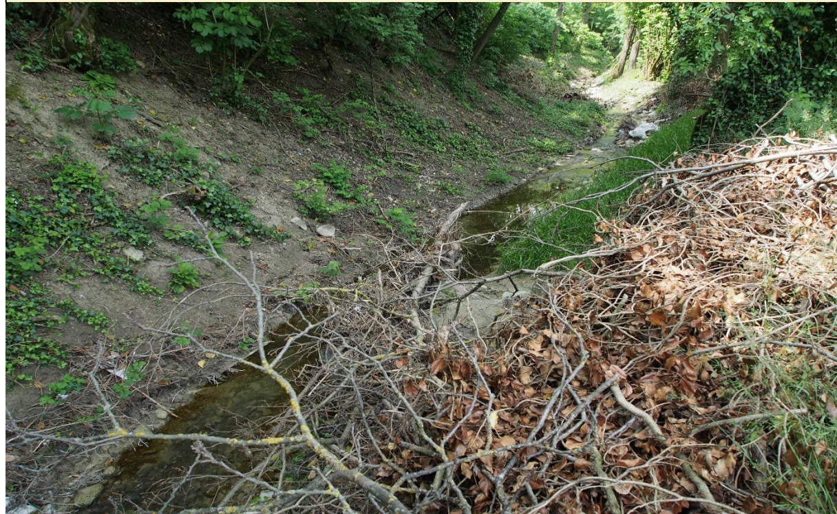
4 – Deflettore di corrente (05/05/2015)