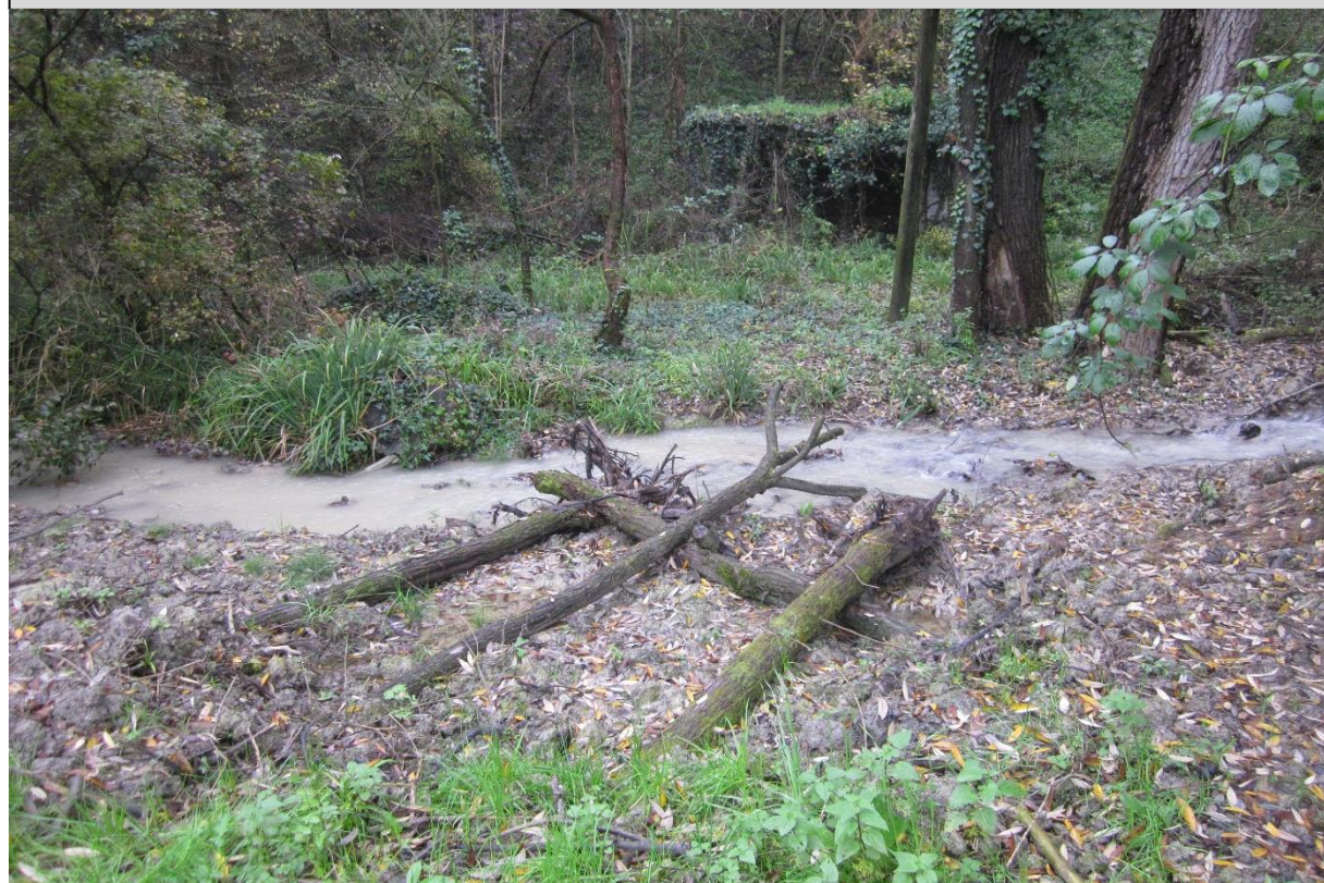
1 – Deflettore di corrente