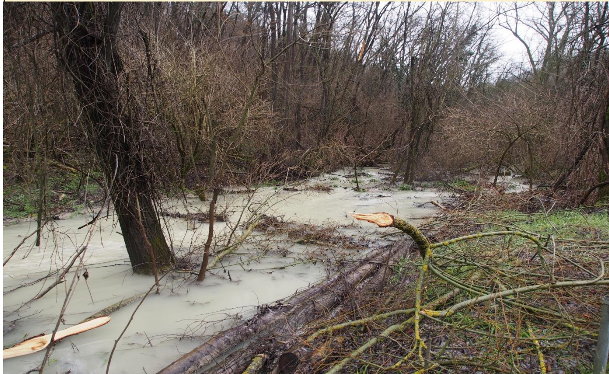
4 - Tronchi con radici esposte