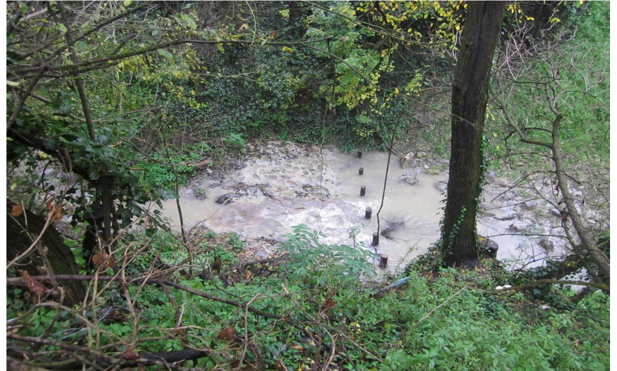
6 - Rampa in massi su briglia esistente