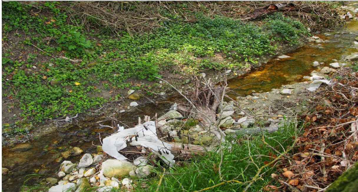
5 – Deflettore di corrente (05/05/2015)