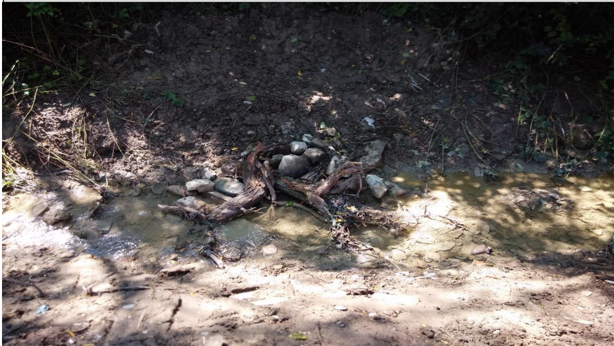
9 – Deflettore di corrente (05/08/2014)