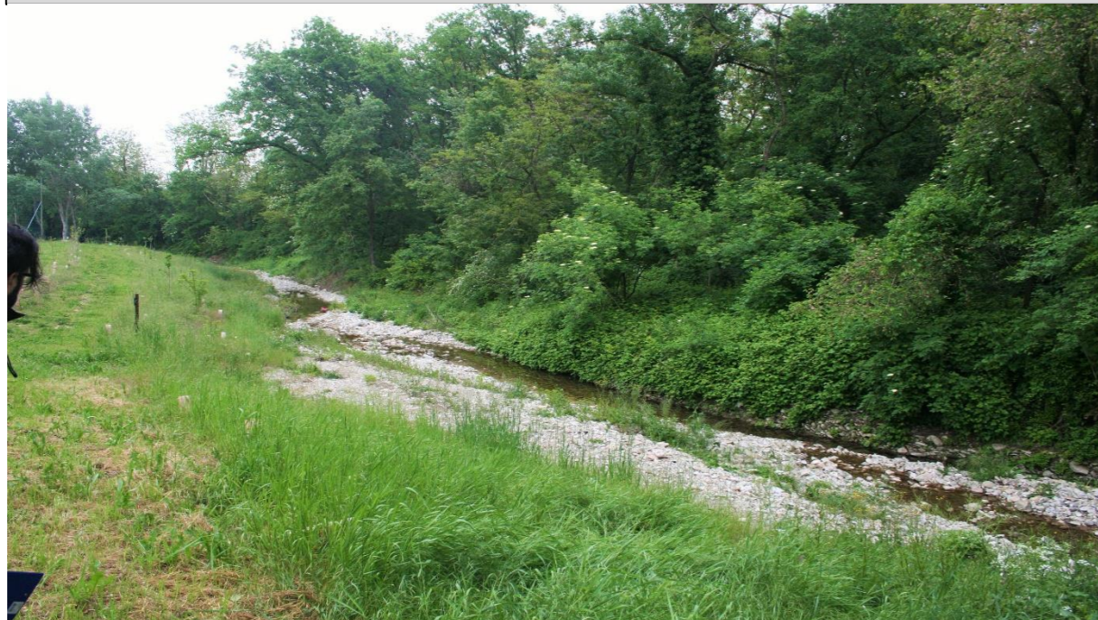
9 – Allargamento di sezione (29/04/2016)