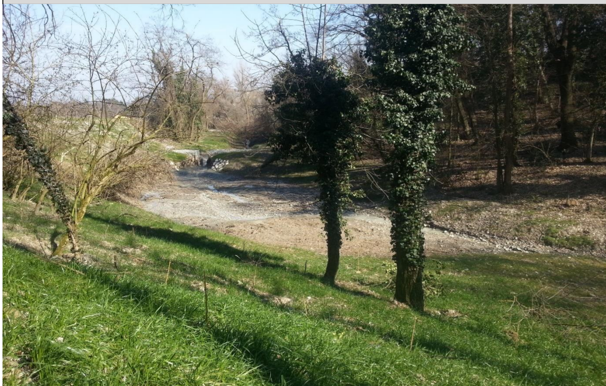
2 - Allargamento di sezione (10/03/2015)