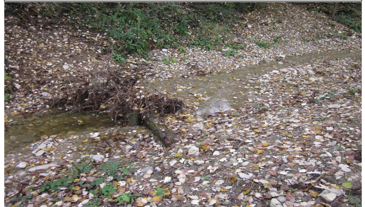
11 – Tronchi a radici esposte (07/11/2014)