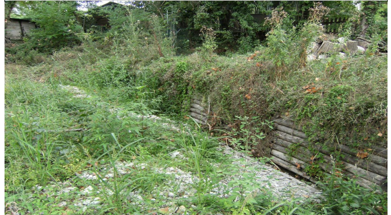
15 – Palificata (18/08/2015)