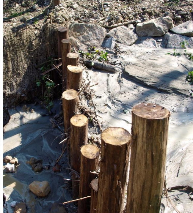
A sinistra: opere realizzate lungo il Rio Bianello. A destra: 1 – Briglia selettiva (10/03/2015)