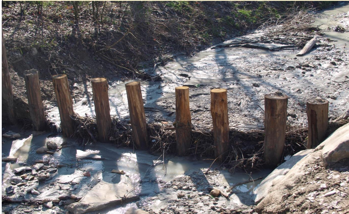
5 – Briglia selettiva (10/03/2015)