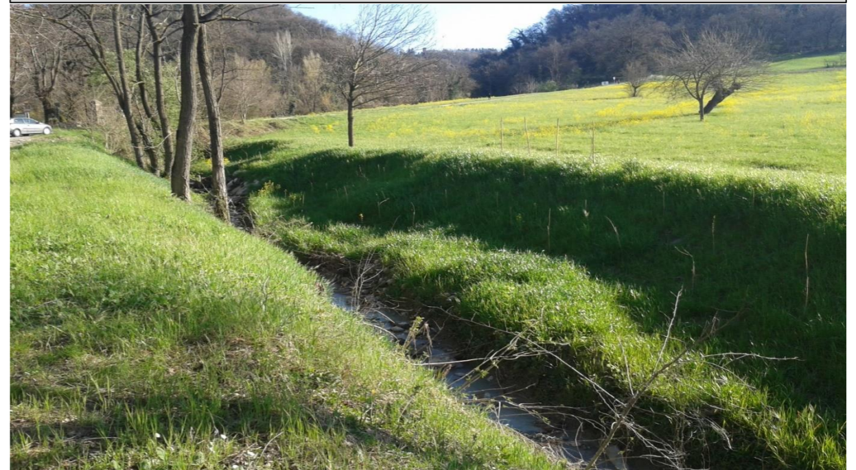
8 – Allargamento di sezione (10/03/2015)