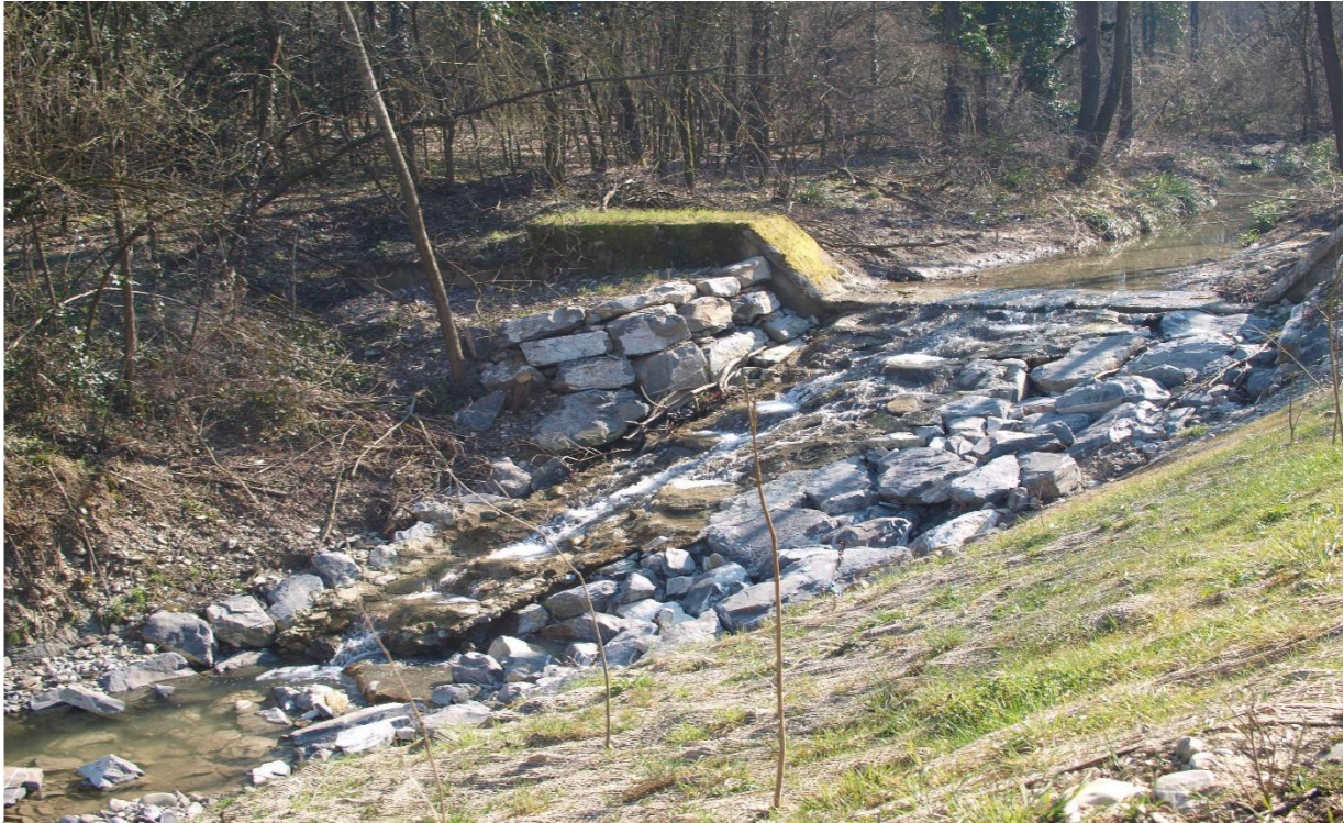
2 – Rampa in massi su briglia esistente(10/03/2015)