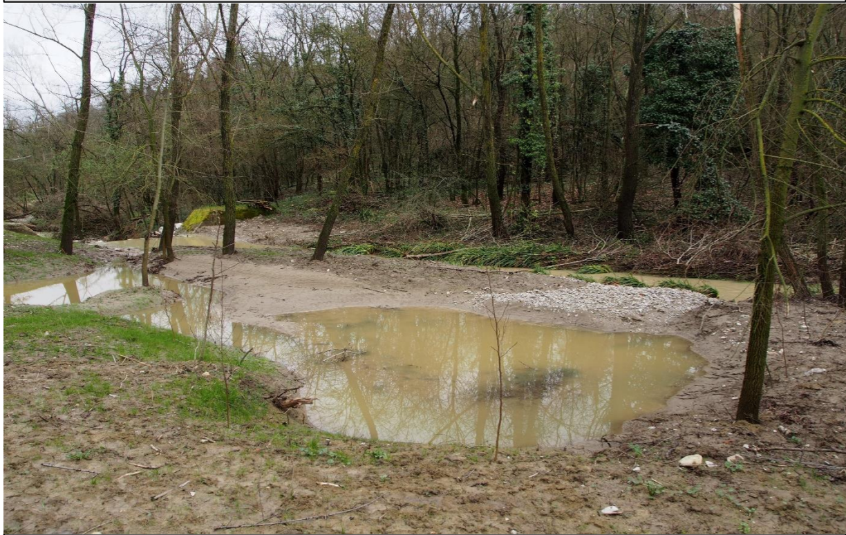
1 – Zona umida (26/03/2015)