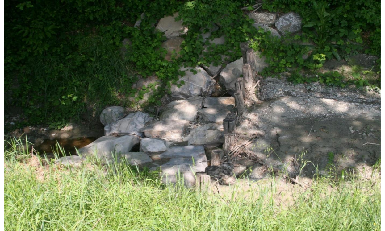
7 – Ripristino briglia selettiva (29/04/2016)