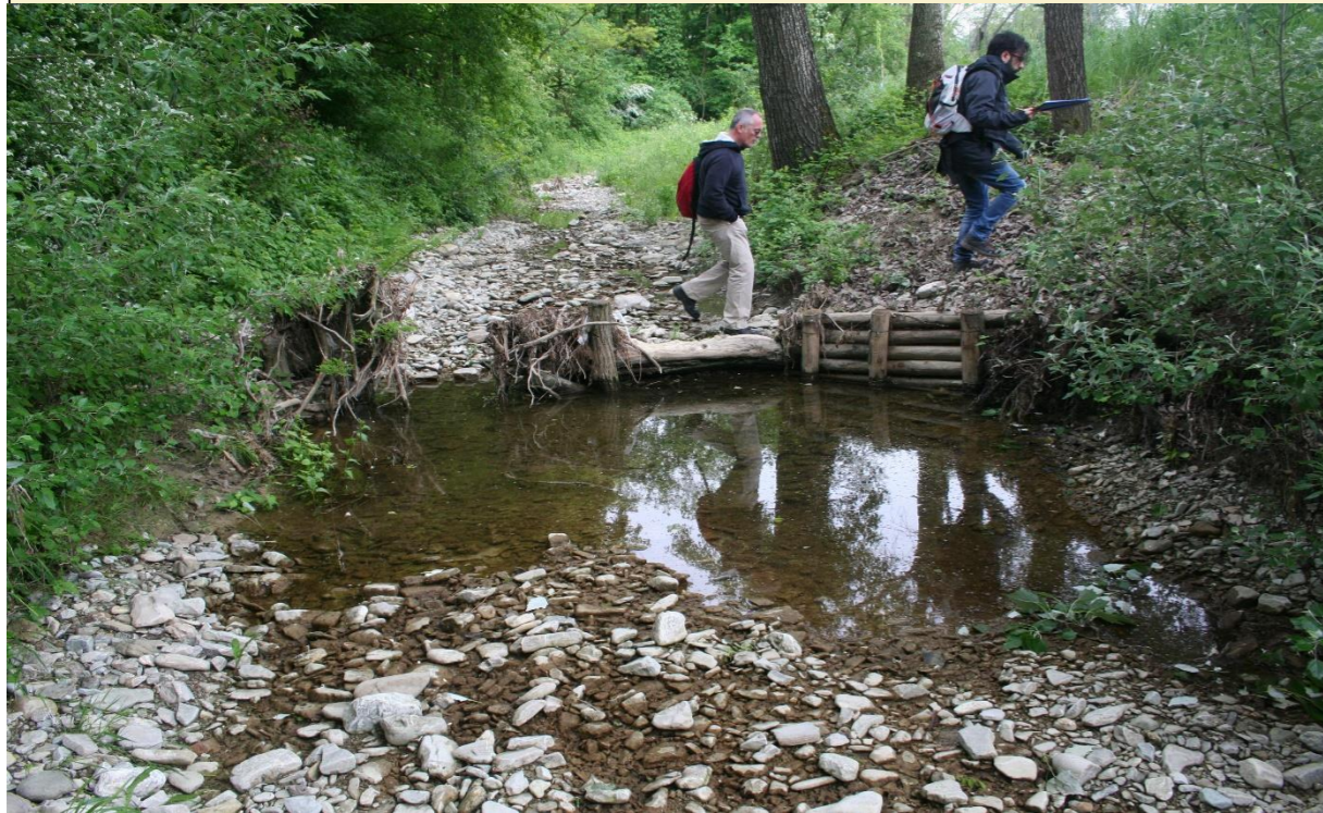
12 – Tronchi a radici esposte (29/04/2016)