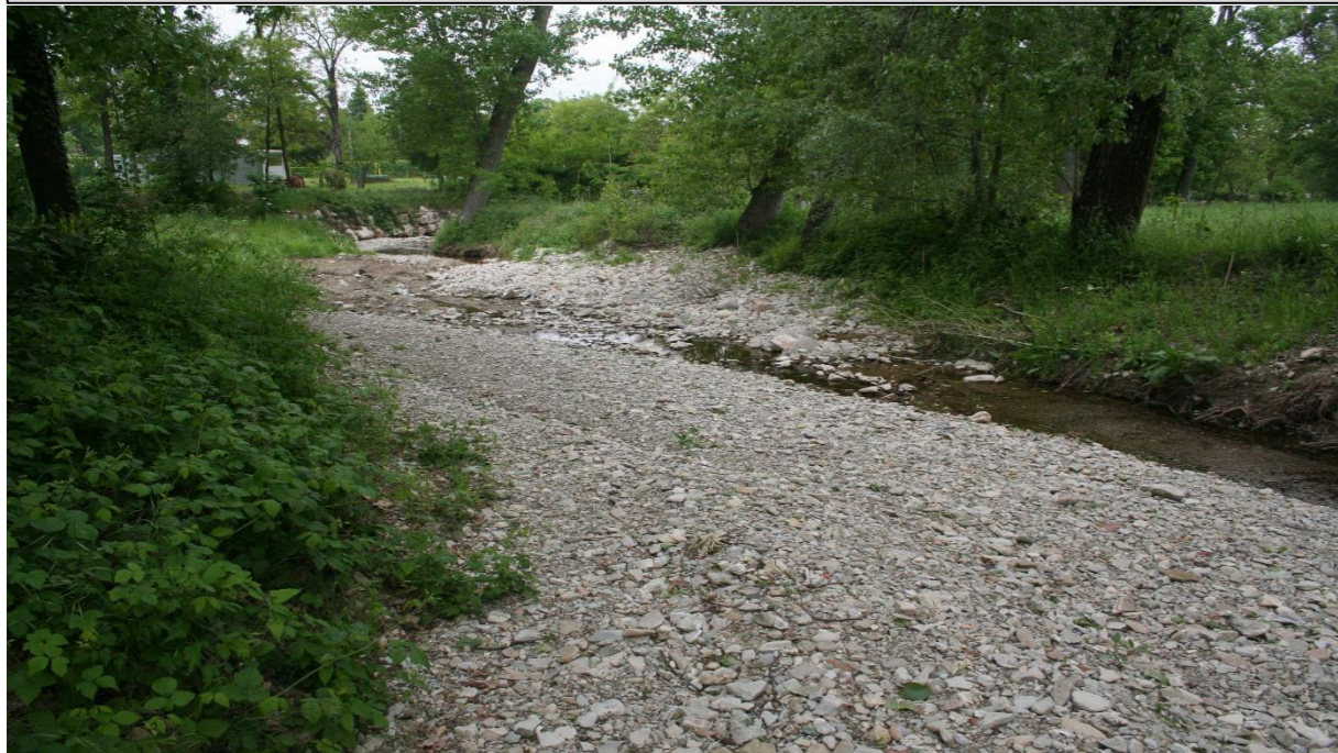
13 – Allargamento di sezione (29/04/2016)