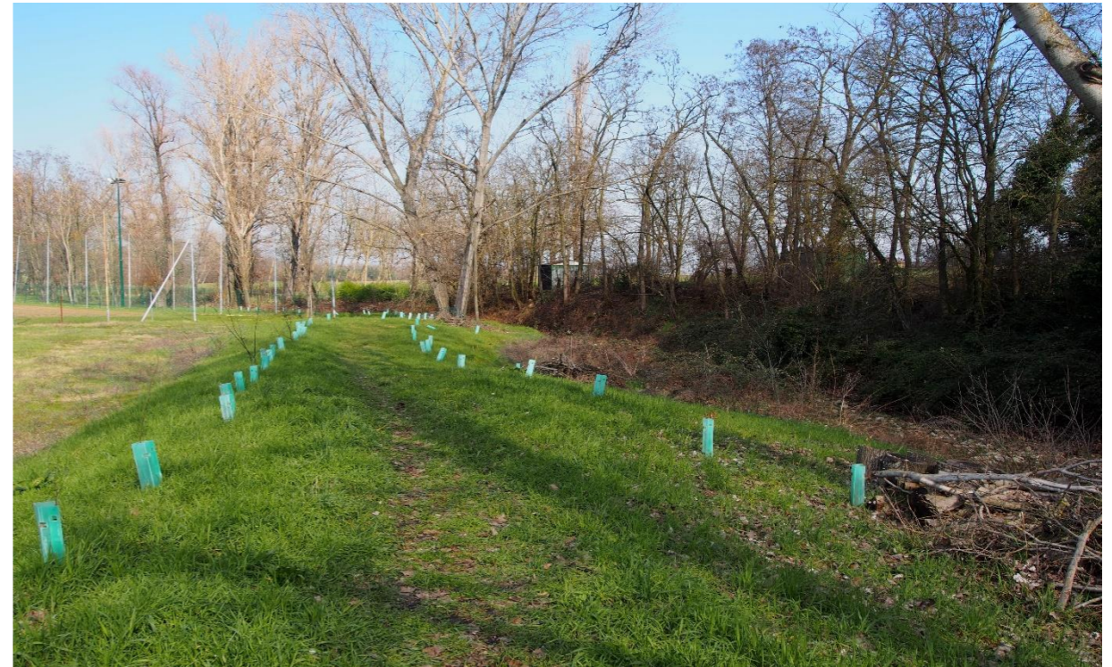
10 - Argine (19/02/2016)