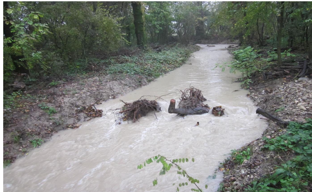
16– Salto di fondo naturaliforme (trinci incrociati) (10/11/2014)