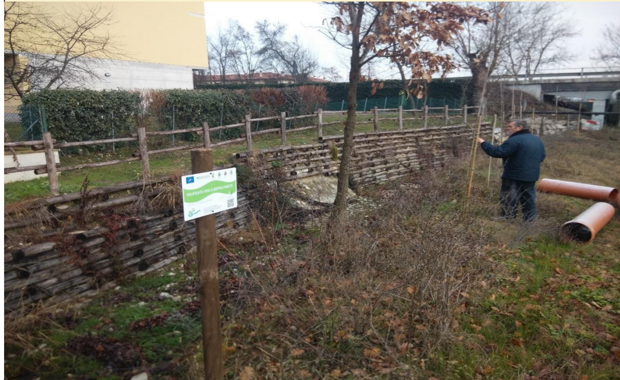
4 – Palificata (08/01/2016)