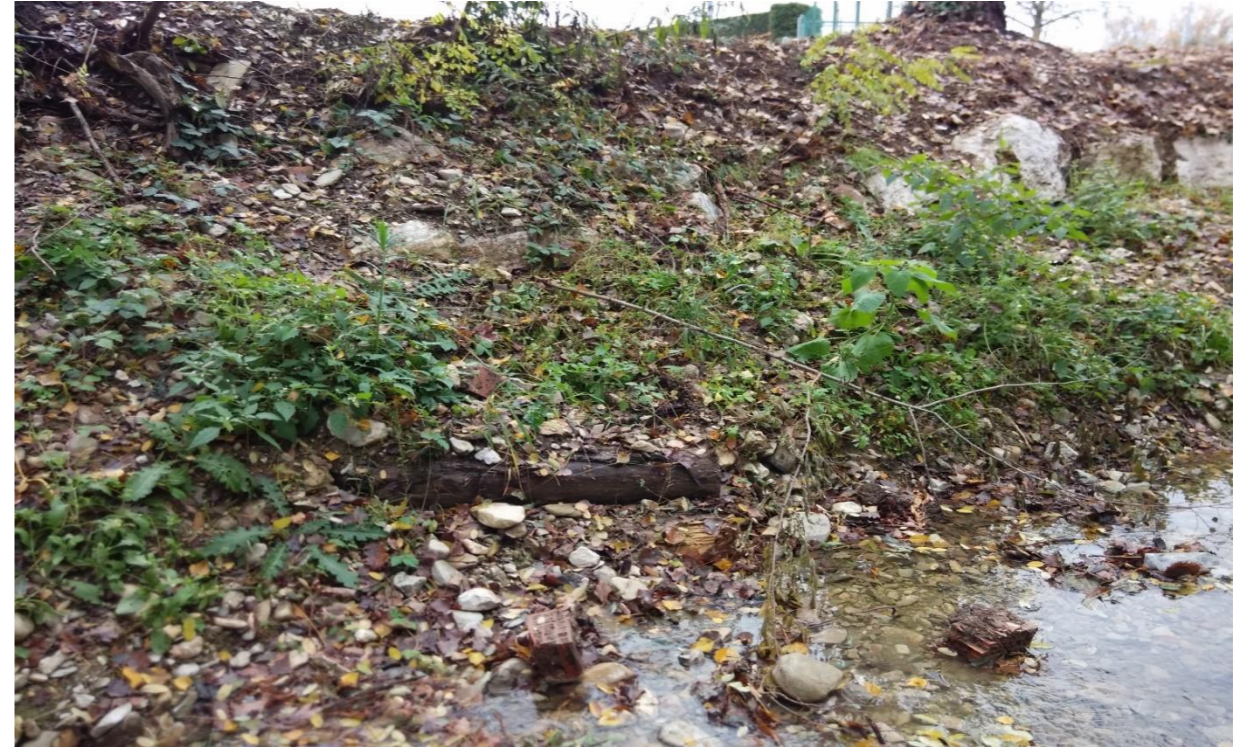
6 – Deflettore di corrente (07/11/2014)