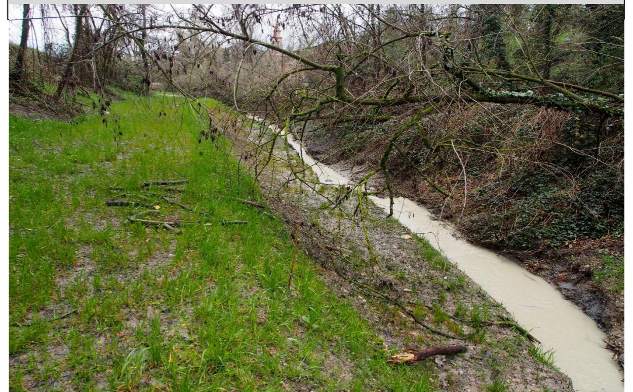
4 - Allargamento di sezione (26/03/2015)