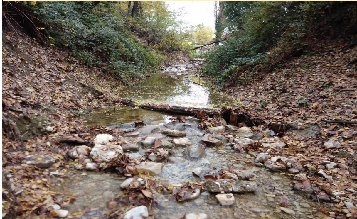
8 – Salto di fondo naturaliforme (tronchi incrociati)(07/11/2014)