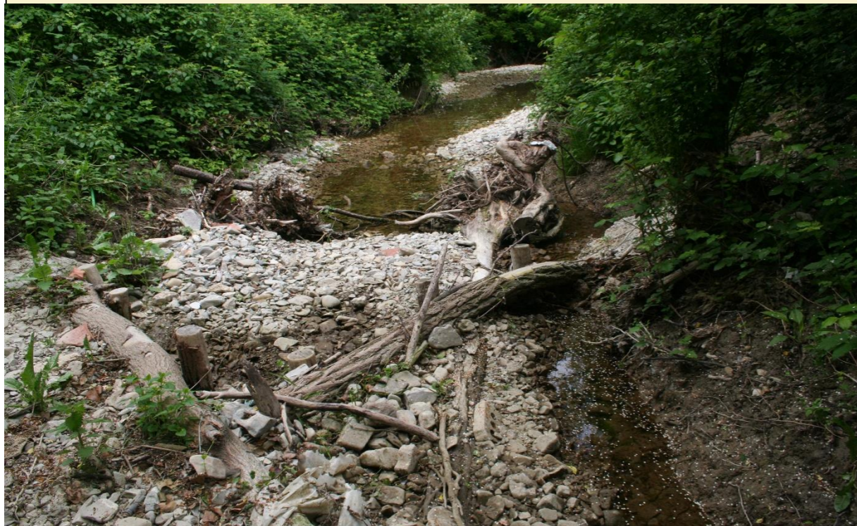
16 – Salto di fondo naturaliforme con radici esposte (29/04/2016)