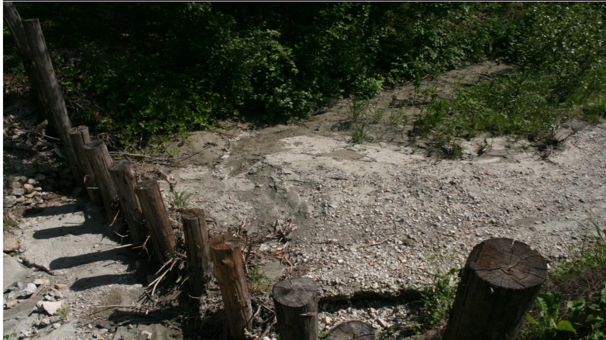
6 – Ripristino briglia selettiva (29/04/2016)