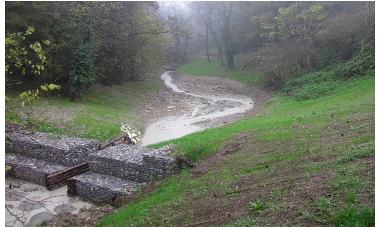
3 – Restringimento di sezione in pietrame a bocca tarata (10/11/2014)