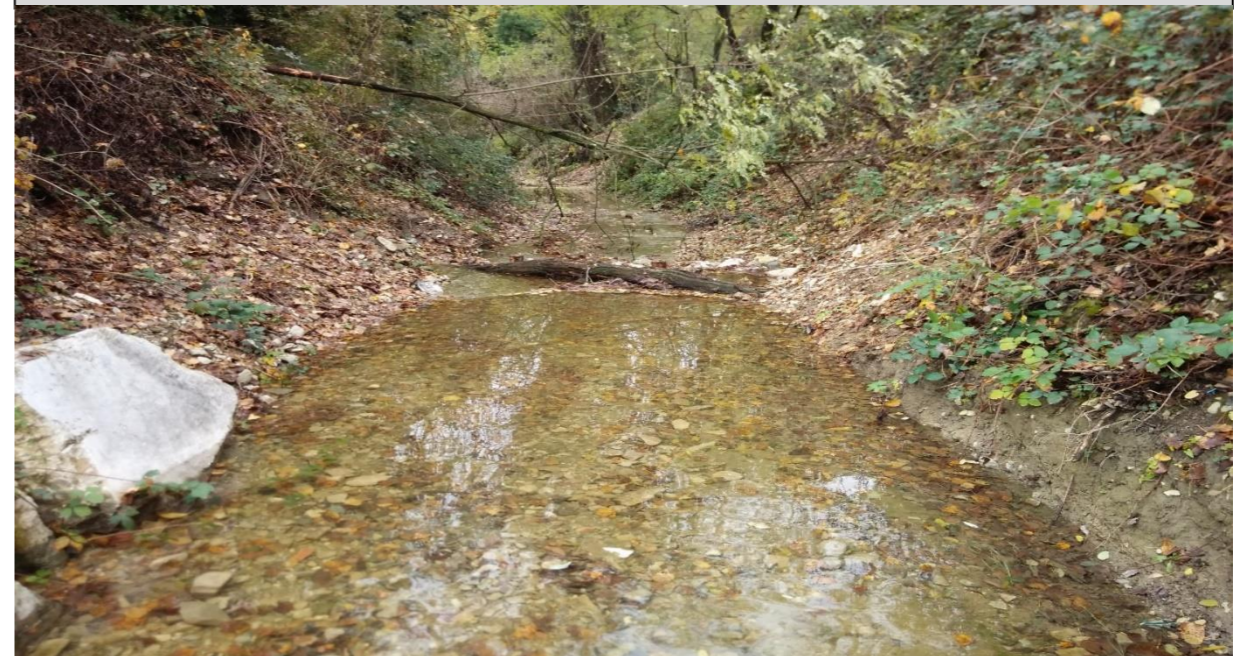
7 - Salto di fondo naturaliforme (tronchi incrociati) (07/11/2014)