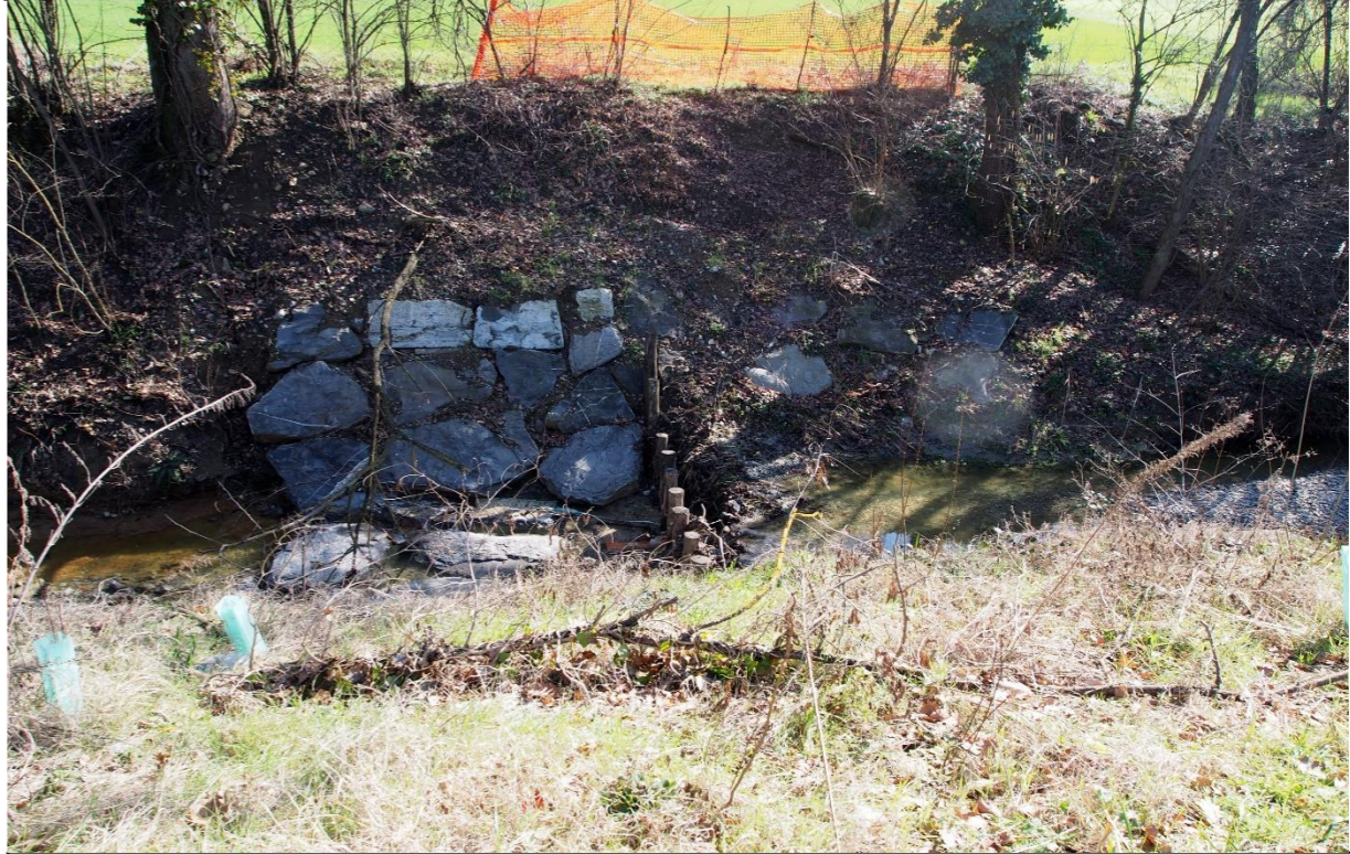
3 – Briglia selettiva (19/02/2016)