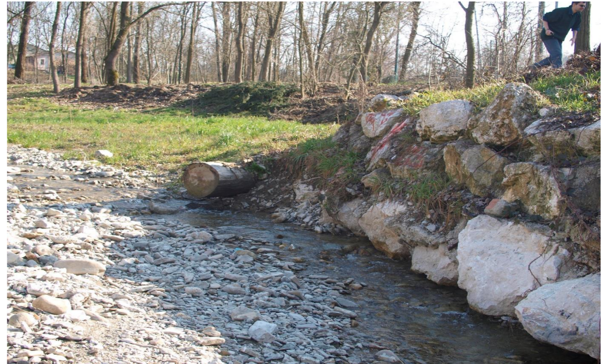
14 – Deflettore di corrente (10/03/2015)