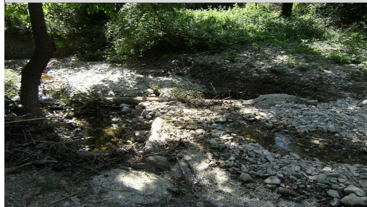
17– Salto di fondo naturaliforme (trinci incrociati) (12/05/2015)