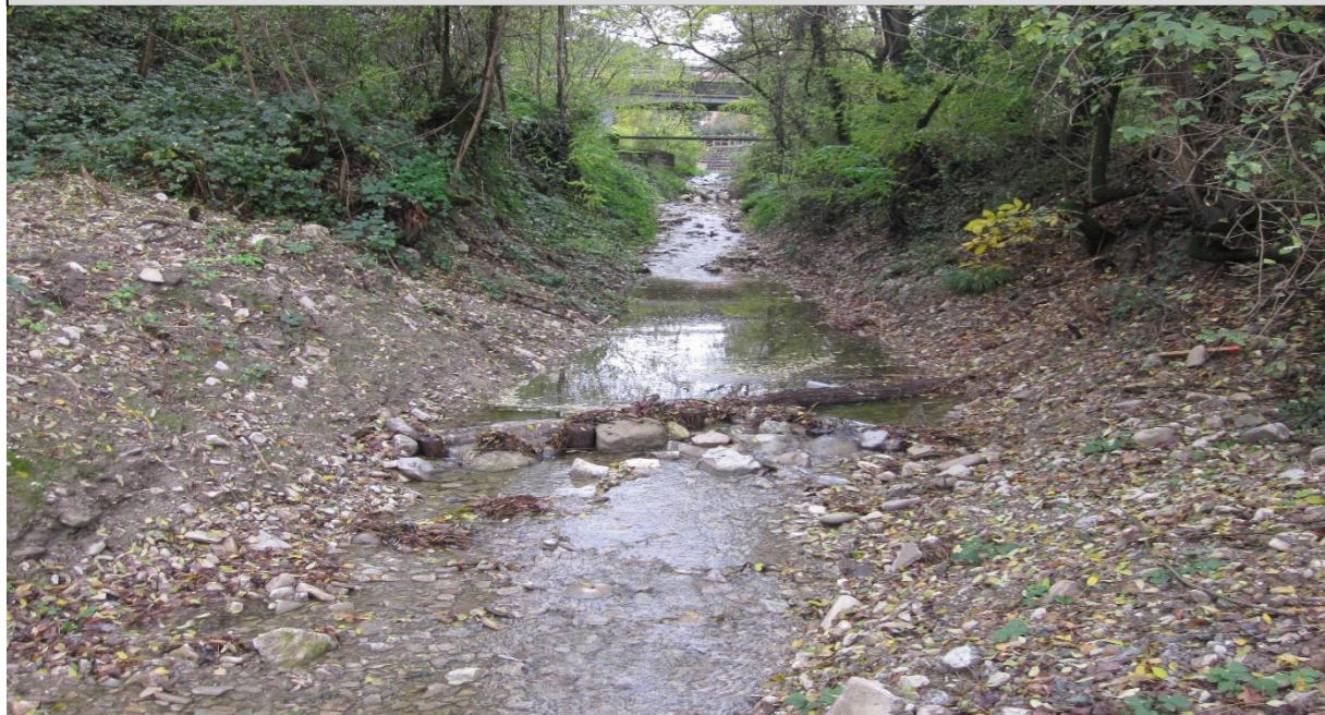
5 - Salto di fondo naturaliforme (tronchi incrociati) (07/11/2014)