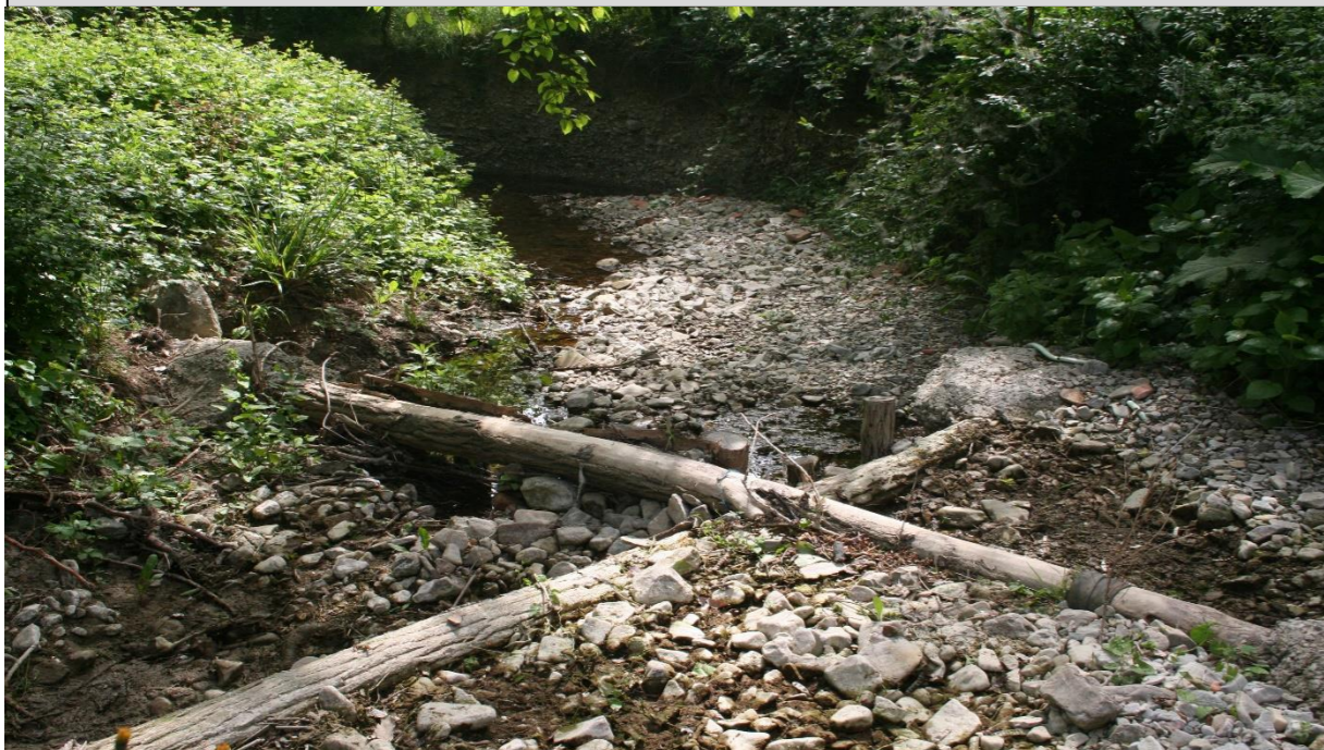
16 – Salto di fondo naturaliforme (trinci incrociati) (29/04/2016)