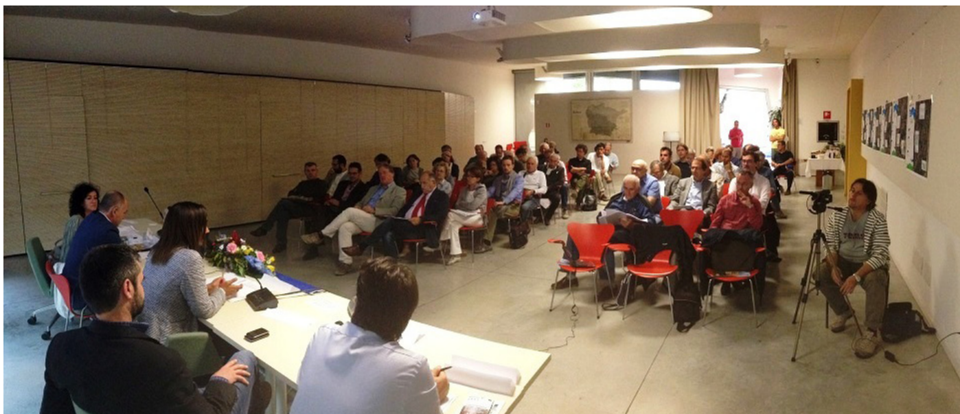
Figura 4 Il Forum finale ad Albinea

attraverso banner pubblicati sui siti internet dei quattro Comuni partner del Progetto e del Consorzio di Bonifica dell'Emilia Centrale, aprendo un canale preferenziale di collaborazione e scambio.