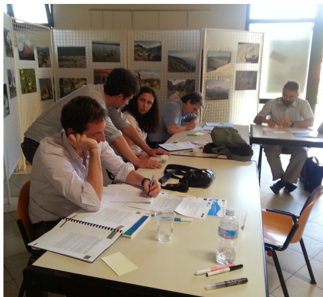
Figura 2 Un momento del Workshop "Scenari e Idee per la riqualficazione"

Ha avuto come obiettivo la definizione di scenari settoriali e la proposta di idee-azioni rispetto alle varie