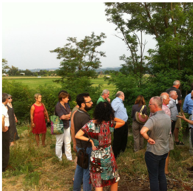
Figura 3 Sopralluogo sul Rio Enzola