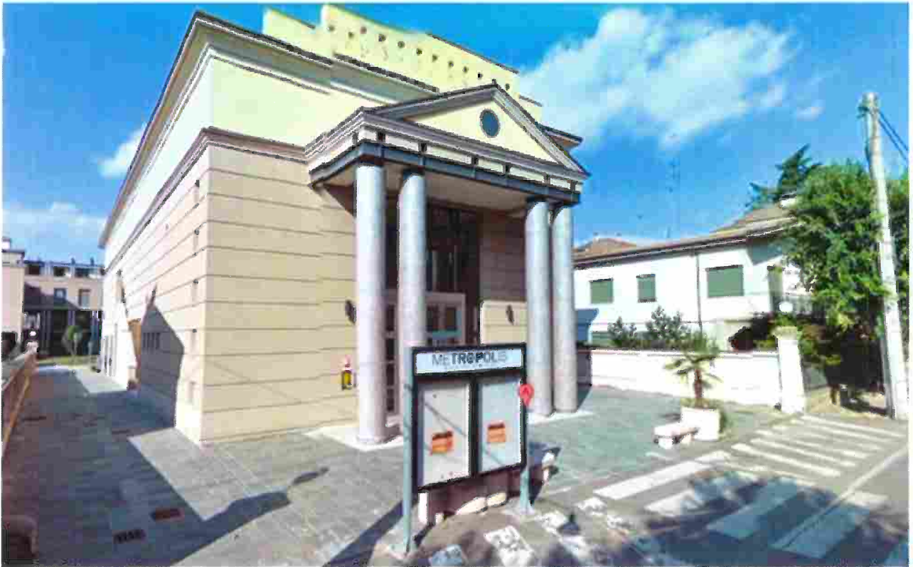
SALA POLIVALENTE – Via Gramsci, 4 – BIBBIANO (RE)