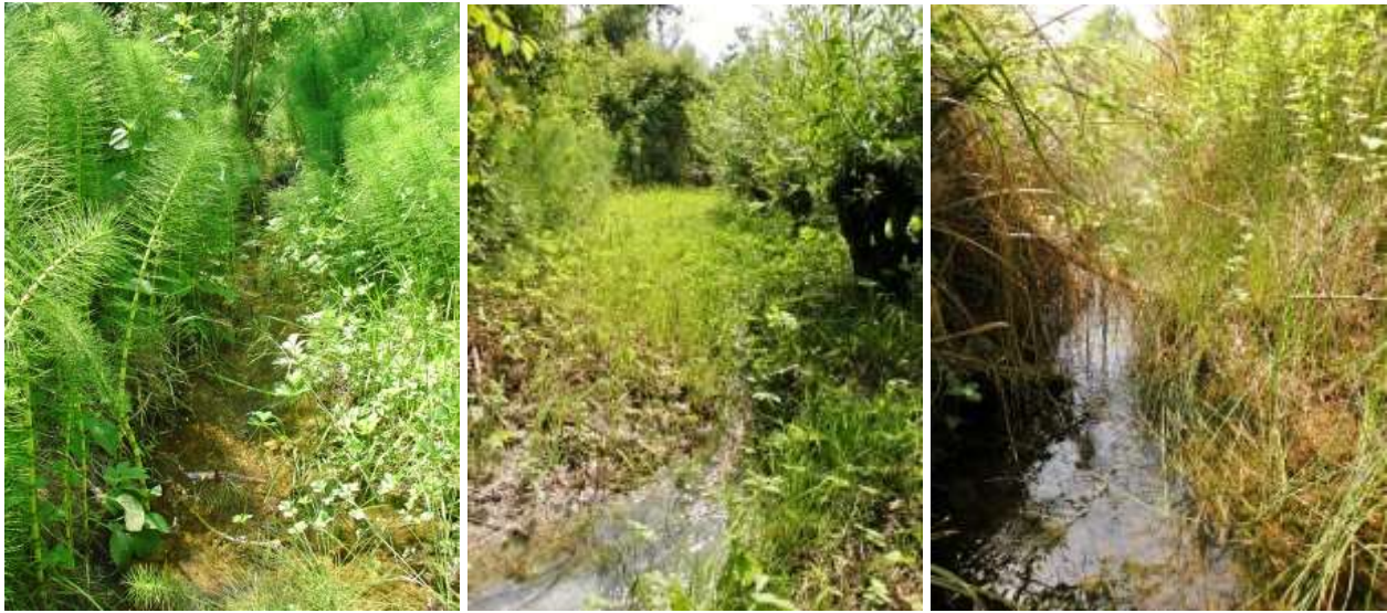
Rii alimentati da sorgenti con insediate popolazioni di C. mercuriale castellanii.