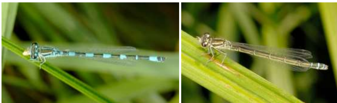
Esemplare adulto maschio a sx e femmina adulta a dx (foto R. Sindaco).

La morfologia larvale degli Odonati appartenenti alla famiglia Coenagrionidae è piuttosto omogenea, con dimensioni inferiori rispetto agli altri Zygoptera, l'addome è conico e le zampe sono di lunghezza tipicamente ridotta, ed in particolare le meta-toraciche non raggiungono l'estremità apicale dell'addome (Carchini, 1983). Nello specifico, la larva di C. mercuriale è di colore giallo opaco, il premento è caratterizzato da due file di lunghe setole e da due gruppi di setole corte spiniformi nella porzione prossimale. Le lamelle caudali sono corte rispetto alla norma nei Coenagrionidae, con massima larghezza a circa metà lunghezza e apice prolungato ed appuntito, generalmente pigmentato di bruno. I margini delle lamelle hanno una fila di setole spiniformi quasi solo nella porzione prossimale ventrale delle lamelle laterali e quasi solo nella porzione prossimale dorsale in quella mediana (Carchini, 1983). Nel complesso la determinazione delle larve e delle esuvie richiede un'analisi accurata possibile solo in laboratorio.