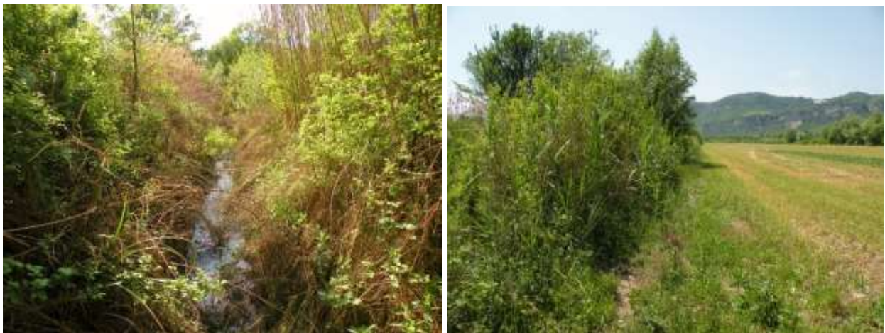
Rio alimentato da sorgente con insediata una popolazione di C. mercuriale castellanii e margine esterno del rio.

C. mercuriale castellanii è associata ad acque correnti (raramente stagnanti ma comunque alimentate da rii), anche fredde, non eccessivamente veloci, in particolare ruscelli, sorgenti e risorgive, spesso di natura carsica fino a 750 m di quota. Caratteristica essenziale per l'idoneità dell'habitat è la presenza di una fitta vegetazione ripariale e sommersa; quest'ultima viene utilizzata per la deposizione delle uova dalla femmina, che può immergersi anche completamente nell'acqua (Thompson et al., 2003b; Trizzino et al., 2013). Il periodo di volo noto per gli adulti va da aprile a settembre, ma nelle regioni meridionali. Durante la stagione riproduttiva il maschio non mostra un comportamento territoriale; si aggancia alla femmina in volo, poi la coppia si posa sulla vegetazione. Al termine dell'accoppiamento la femmina cerca un luogo idoneo per l'ovideposizione, spesso in compagnia del maschio; le uova impiegano da due a sei settimane per schiudersi e lo sviluppo si completa generalmente in circa un anno (Thompson et al., 2003b; Trizzino et al., 2013). La specie in Italia potrebbe avere due generazioni distinte.