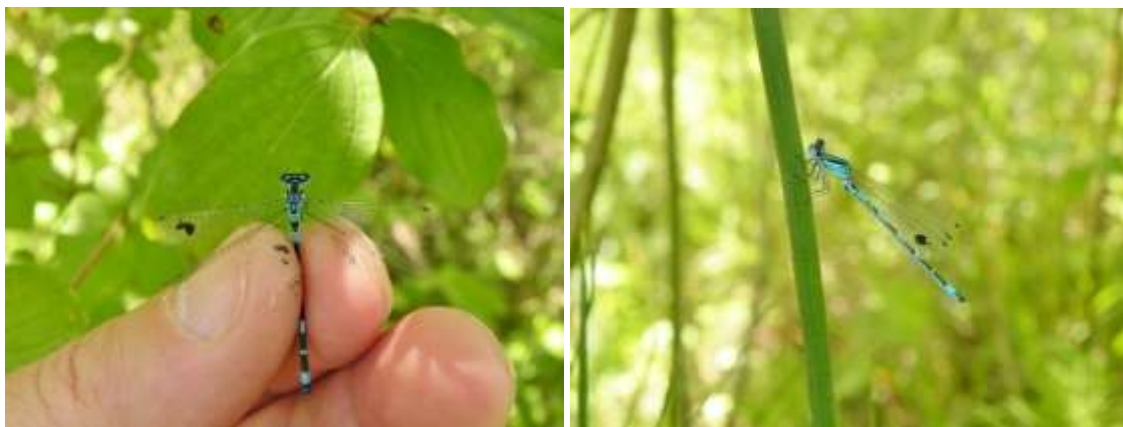
Esemplari maschi di C. mercuriale castellanii marcati con pallino nero su ala anteriore sx.

Tutte le fasi del monitoraggio dovranno essere documentate, fotografate e filmate.